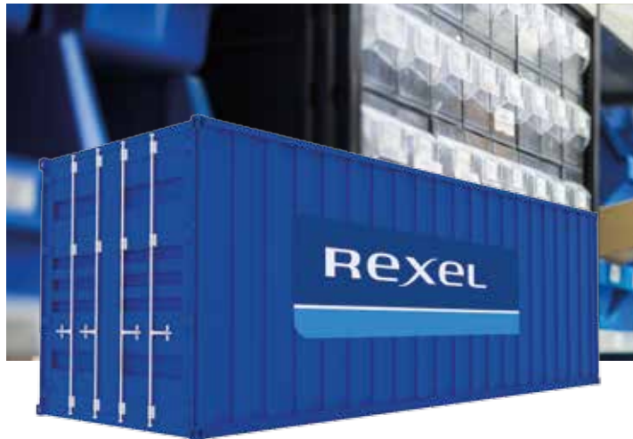
Rexel VMI containers die op diverse (project)locaties worden gebruikt

De grotere efficiency draagt direct bij aan soepel verlopende bedrijfsprocessen. Wilt u meer informatie of weten wat VMI voor u kan betekenen? Neem dan contact op met uw Rexel Account Manager.